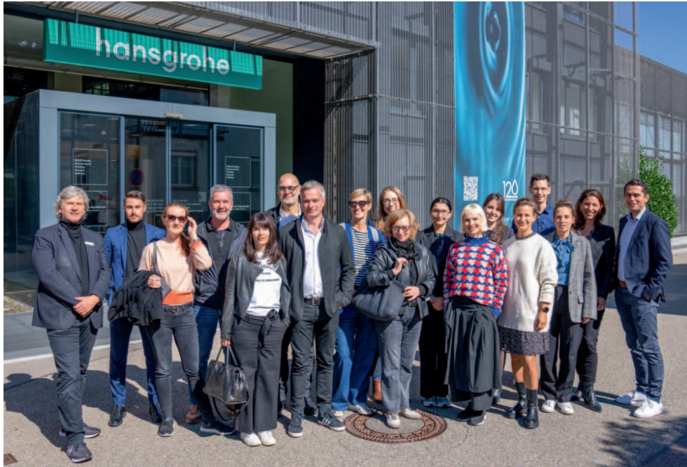
Die TeilnehmerInnen des Produkttests gemeinsam mit dem Team von hansgrohe vor der Aquademie

ARCHITEKT*INNEN UND INNENARCHITEKT*INNEN TESTEN RAINTUNES VON HANSGROHE